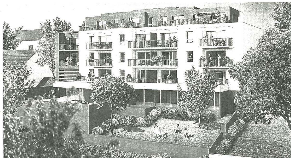
Le futur ensemble comptera seize logements.

Ils ont été conçus par le cabinet d'architecte Alinéa, de Vannes. Tous les logements sont exposés sud, donnant tous sur le Blavet. L'accent a été mis sur l'isolation phonique : il y a une chape acoustique de 6 cm de chape flottante qui désolidarise chaque appartement. Et toutes les cloisons de distribution font 7 cm, avec placostyle et laine de roche de 45 mm. Autre particularité, le recours à une domotique élaborée, de fabrication française : chaque appartement est équipé d'une tablette raccordée sur un appareillage qui