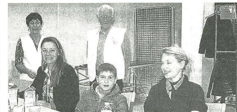
Entourées des bénévoles de l'association des donneurs de sang, deux nouvelles donneuses.

Les donneurs de sang plus nombreux à la collecte