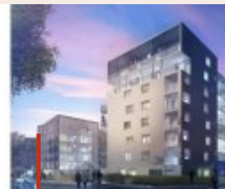
► Rennes Ille et Vilaine 35 3, 4, 5 pièces