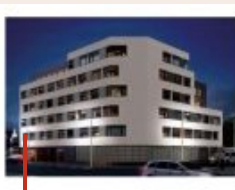
► Rennes Ille et Vilaine 35 1, 2 pièces