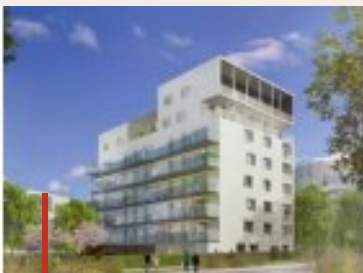
► Rennes Ille et Vilaine 35 3, 4, 5 pièces