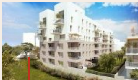
► Rennes Ille et Vilaine 35 3, 4, 5 pièces